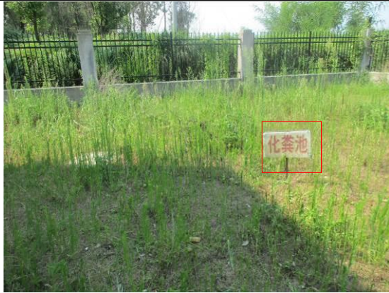
生活办公区设置的化粪池