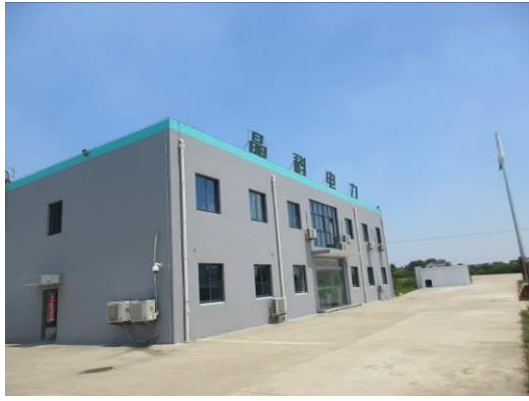
沙岗村光伏电站生活区办公楼