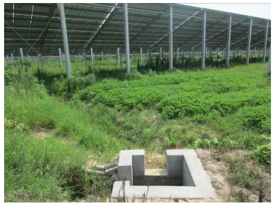
光伏区设置的沉淀池