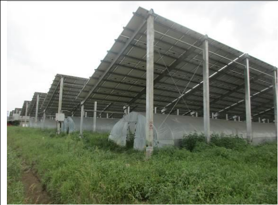
光伏区农作物种植