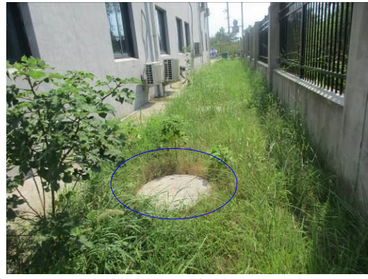
生活办公区设置的污水收集系统