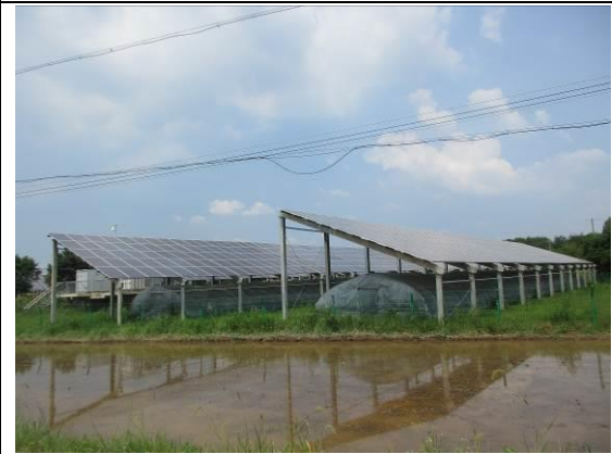
光伏区农作物种植