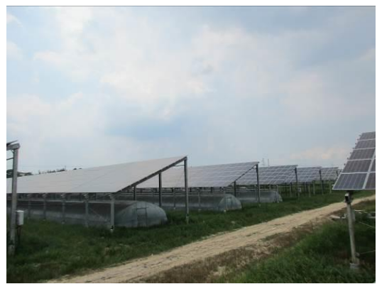
光伏区农作物种植